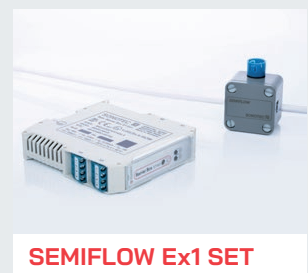
SEMIFLOW Ex1 SET